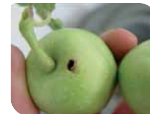
jabukin smotavac ( Cydia pomonella )

tradicionalni insekticid protiv štetočina u voću, povrću i ratarskim biljkama