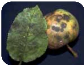
čadava pegavost lista i krastavost plodova jabuke ( Venturia inaequalis )