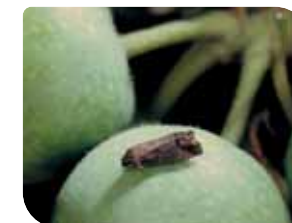
jabukin smotavac ( Cydia pomonella )

tradicionalni insekticid protiv štetočina u voću, povrću i ratarskim biljkama