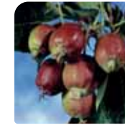
plodovi veličine lešnika