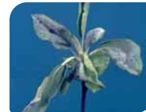
pepelnica jabuke ( Podosphaera leucotricha )