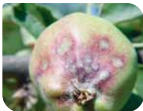
čadava pegavost lista i krastavost plodova jabuke ( Venturia inaequalis )