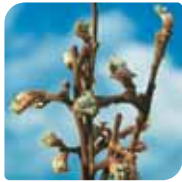
faza mišijih ušiju i zelenih buketića